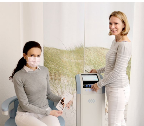
Die beiden Fachärztinnen demonstrieren den BTL Emsella™-Stuhl.